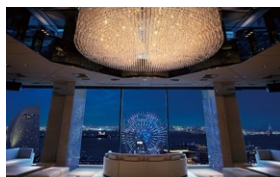
3.クリスタルラウンジ