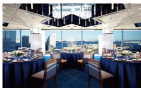
1.メインダイニング