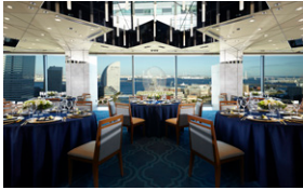
1.メインダイニング