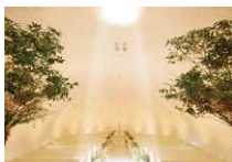
3. クリスタルホール