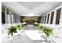
2 クリスタルホール