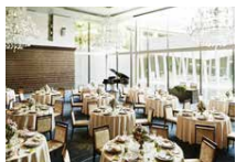
1 メインダイニング