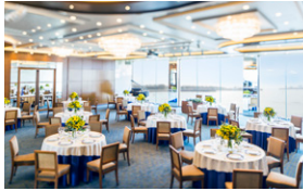
2.メインダイニング-BREEZE BAY-