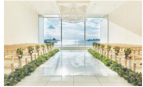
3.クリスタルホール