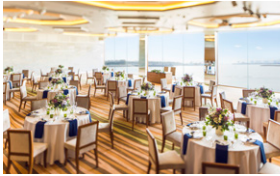
1.メインダイニング-THE SEAS-