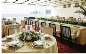
2.メインダイニング緋-AKE-