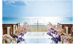
3.クリスタルホール