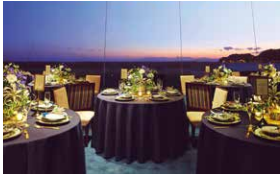
1.メインダイニング碧-HEKI-